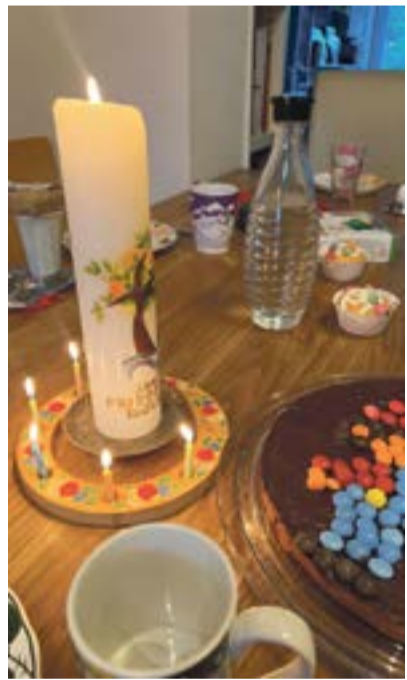
Geburtstag: Die Taufkerze brennt bei jedem wichtigen Anlass

Der Vorname sollte draufstehen, schön auch das Taufdatum und passend ein oder mehrere biblische Symbole. Beliebt sind zu Beispiel Regenbogen, Baum, Engel, Sonne und Fisch (das »Geheimzeichen« der ersten Christen. Das griechische Wort für Fisch »Ichtus« sind die Anfangsbuchstaben des Be-