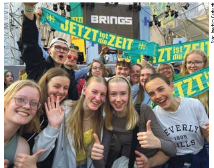
Festival des Glaubens: Bonner Jugendliche beim Kirchentag im Mai 2023 in Nürnberg